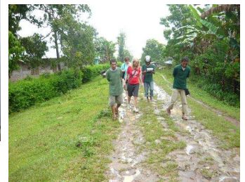
Lopen van patiënt naar patiënt op gladder wegen