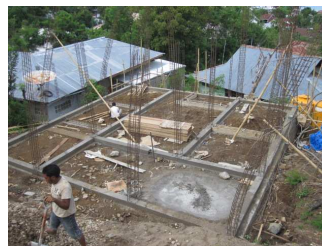
Indeling van de benedenkamers al zichtbaar