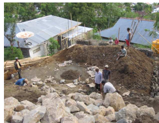
Het begin van de fundering