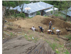
De eerste graafwerkzaamheden