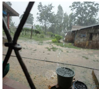
Regen in de camping